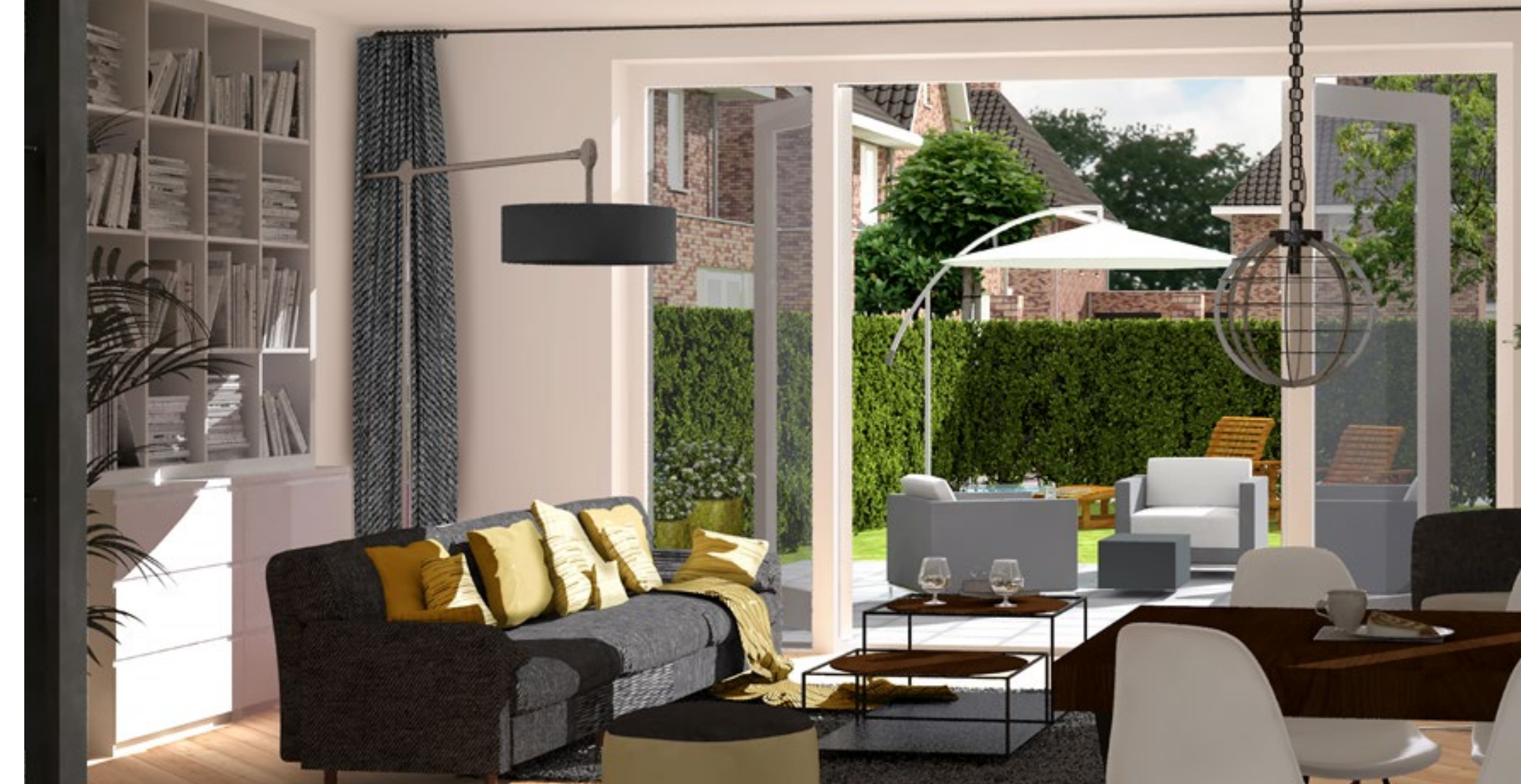
WOONOPPERVLAK BNR. 166 CA. 136 M 2 GO WOONOPPERVLAK BNR. 169 EN 173 CA. 142 M 2 GO