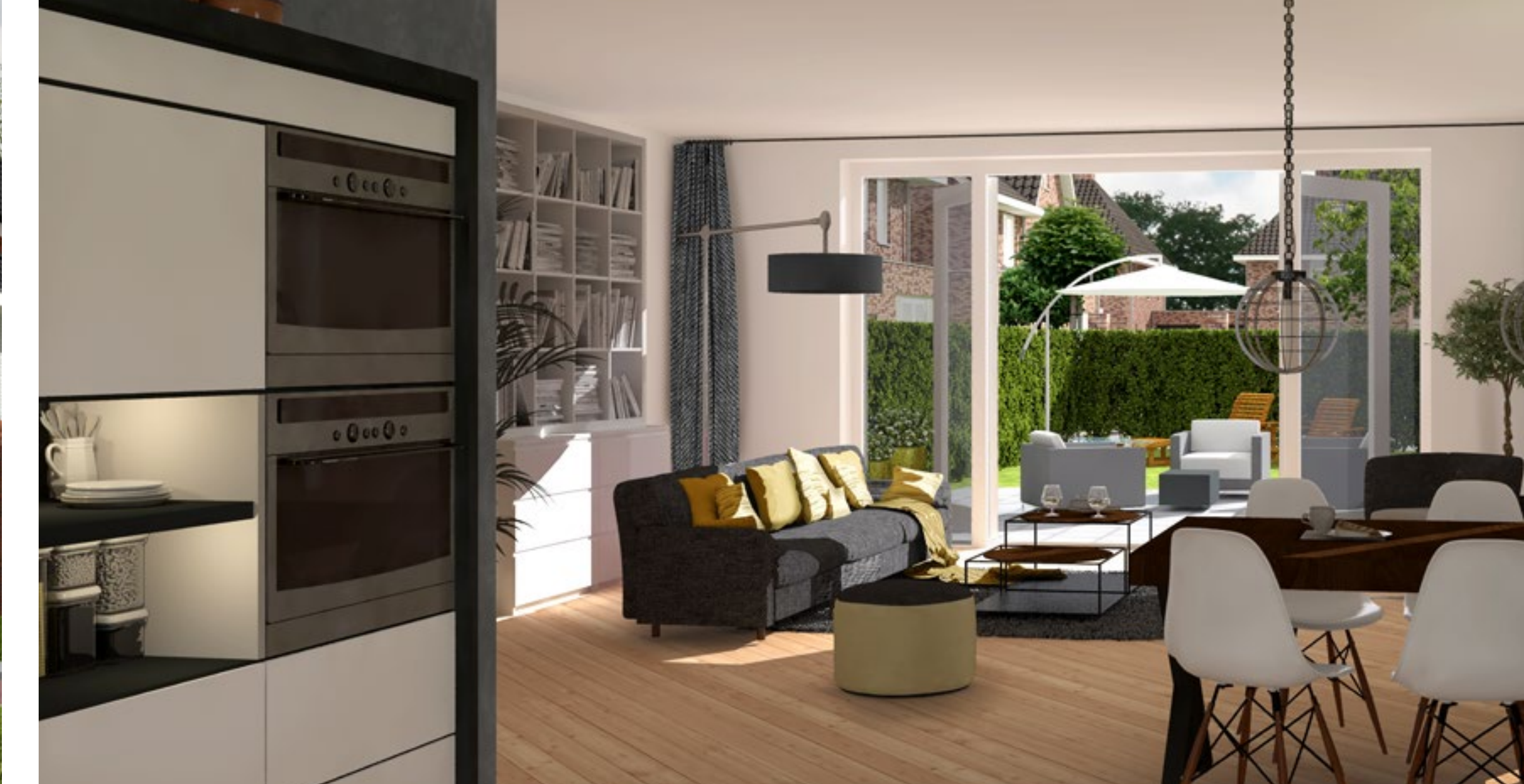
WOONOPPERVLAK CA. 129 M 2 GO