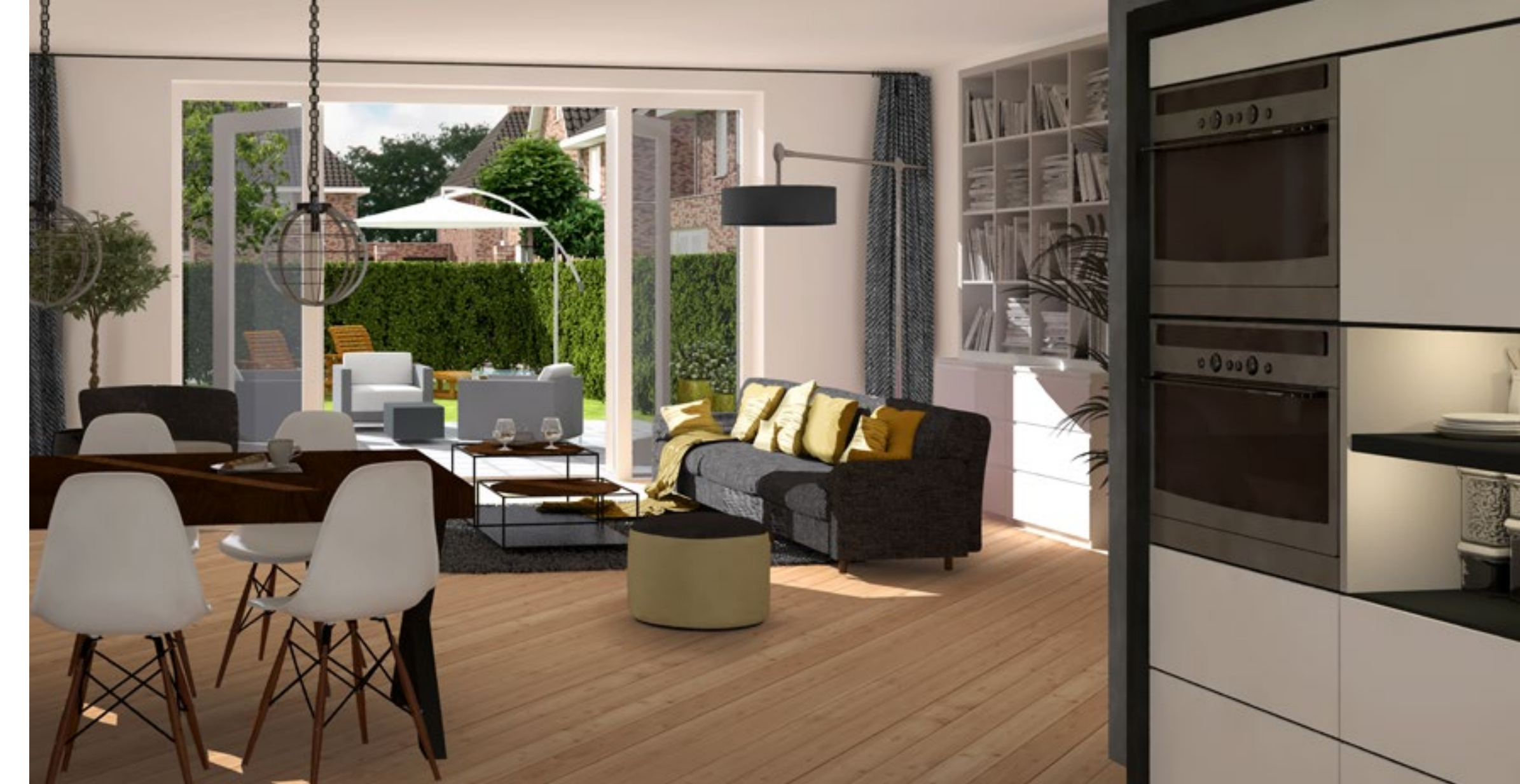
WOONOPP. BNR. 132 CA. 153 M 2 GO EN BNR. 133 CA. 145 M 2 GO