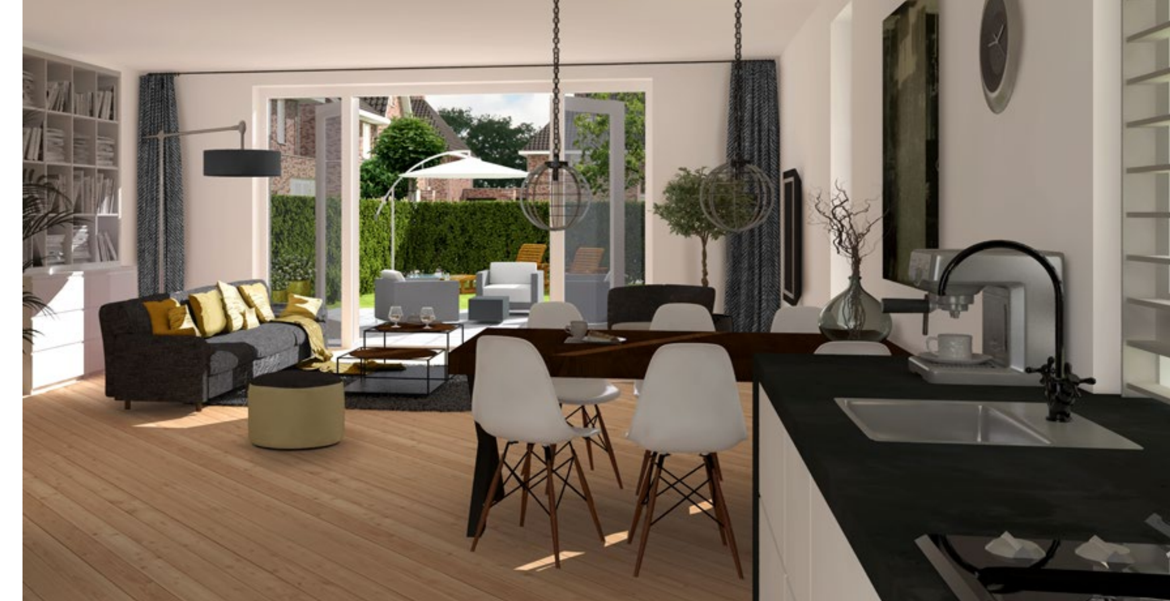
WOONOPP. BNR. 128 EN 129 CA. 136 M 2 GO WOONOPP. BNR. 135 EN 136 CA. 129 M 2 GO